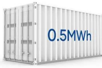
Standard 20ft containers